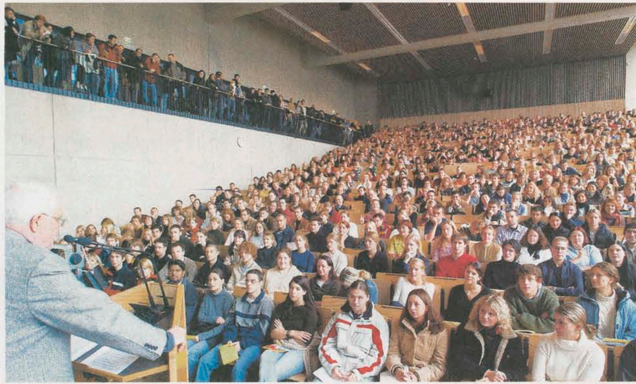
Massenvorlesung im Hörsaal: Die doppelten Abiturjahrgänge werden das Problem noch verschärfen.